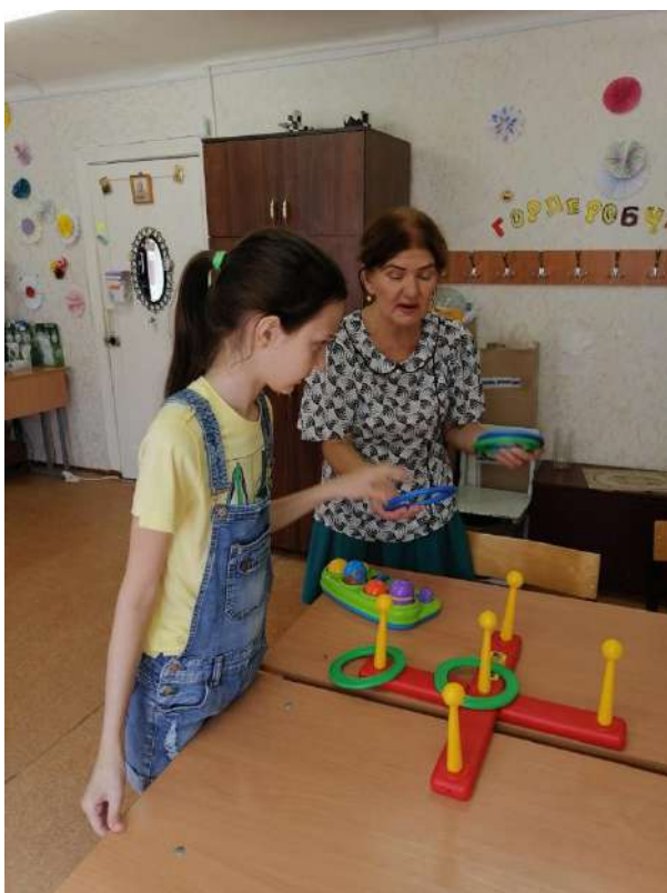
Фото процесса занятий